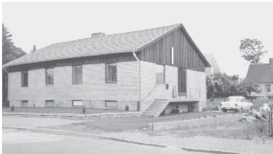
Den nya fabriken på Östergatan 41. Här ligger nu Lundqvists Rörlednings-firma. I bakgrunden t.h. huset på Rååvågen 74.