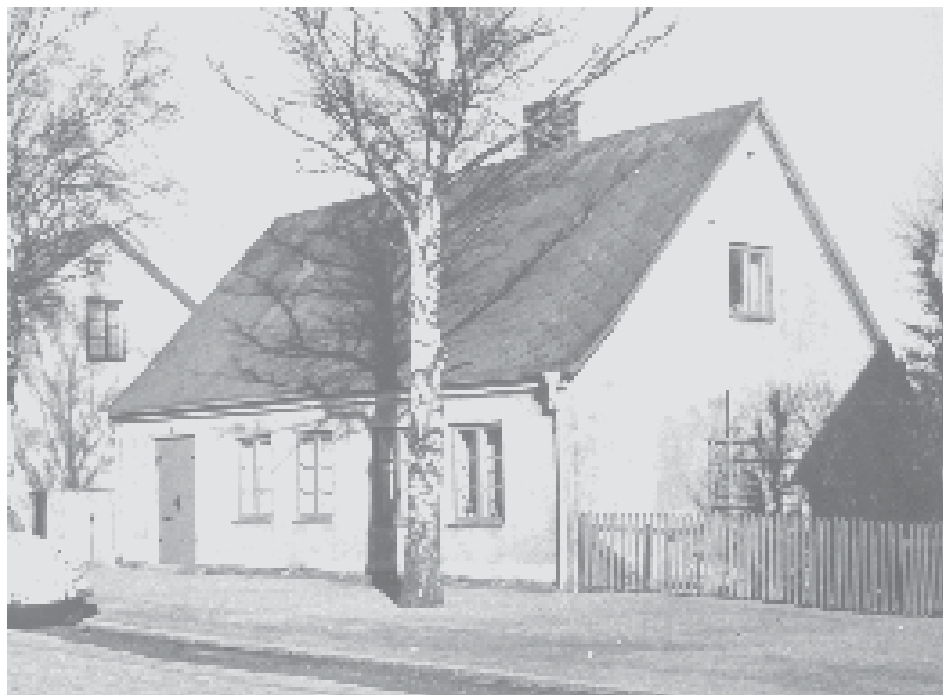
Fabriken var inrymd i huset på Rååvägen 74 under tiden 1902-1964. kan.